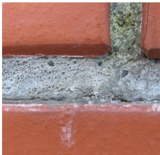
Zdjęcie 3. Zwarta, szczelna zaprawa o strukturze betonu.

Wysolenia pojawiają się na licach cegieł (Zdjęcie 2), lub na połączeniu zaprawa/cegła (Zdjęcie 4). W obydwu przypadkach, za ich powstanie odpowiedzialna jest zbyt szczelna, zwarta, mało przepuszczalna zaprawa murarska. W wyniku stosowania zapraw opartych wyłącznie na cemencie, uzyskujemy spoinę quasi betonową (Zdjęcie 3). Cegła staje się bardziej przepuszczalna niż zaprawa, i to właśnie przez cegłę odbywa się transport wody wraz z zawartymi w niej solami. Natomiast w przypadku pokazanym na Zdjęciu 4 dodatkowym elementem wywołującym wysolenia jest marnej jakości połączenie zaprawa/cegła. Dzięki temu woda ma swobodny dostęp do wnętrza muru.