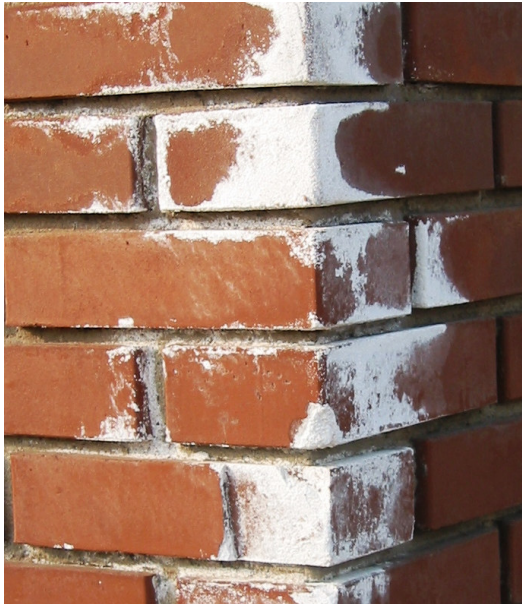
Zdjęcie 1. Białe wysolenia na cegle nie oznaczają, że jest to wapno.

Skąd te rozbieżności między powszechnie słyszаныmi opiniami o wapnie, a dobrą praktyką murarską? Być może stąd, że większość nalotów, jakie pojawia się na cegle, lub na łączeniu cegła/zaprawa ma jasne zabarwienie. A w związku z tym większość wykonawców i inwestorów, jak i ludzi nie zaangażowanych bezpośrednio w proces budowy błędnie sądzi, że jak jakiś nalot jest biały to na pewno jest to wapno hydratyzowane (Zdjęcie 1). Tak naprawdę za każdym razem należy wykonać analizę chemiczną, aby stwierdzić rodzaj związku, jaki pojawił się na elewacji.