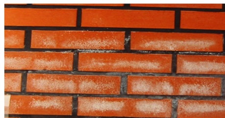
Zdjęcie 2. Nieprzepuszczalna zaprawa spowodowała powstanie wysoleń na licach cegieł.