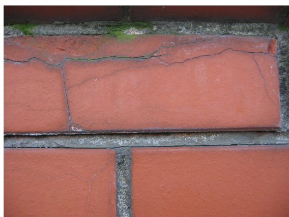
Zdjęcie 5. Zaprawa cementowa z domieszką napowietrzającą. Widoczna jest utrata przyczepności zaprawy do podłoża.