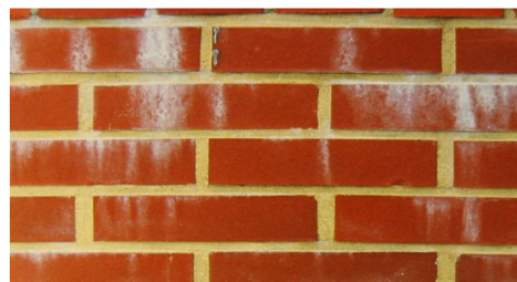
Zdjęcie 4. Nieszczelne połączenie murarskie przyczyną powstania zacieków.

Przed zaprawą do klinkieru stawiane są szczególnie wysokie wymagania. Zaprawa murarska powinna nie tylko łączyć cegły w stabilną konstrukcję murową, lecz również stanowić bariere dla wnikania wody do wnętrza muru. A kiedy woda już się tam pojawi, powinna umożliwić jej łatwe wyprowadzenie poza obręb muru. Za dwie najważniejsze właściwości każdej zaprawy (nie tylko tej do klinkieru) należy uznać przyczepność oraz przepuszczalność.